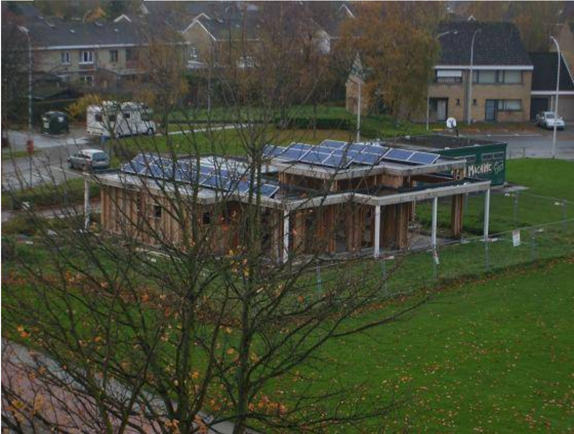
(foto: zonnepanelen op het dak van Lokale Dienst Sint-Jozef 'Teen Machine')

Maar ook aan de bouw van het paviljoen werd een bijkomende (misschien wel de allerbelangrijkste) doelstelling gekoppeld: samenwerken met sociale economie projecten.