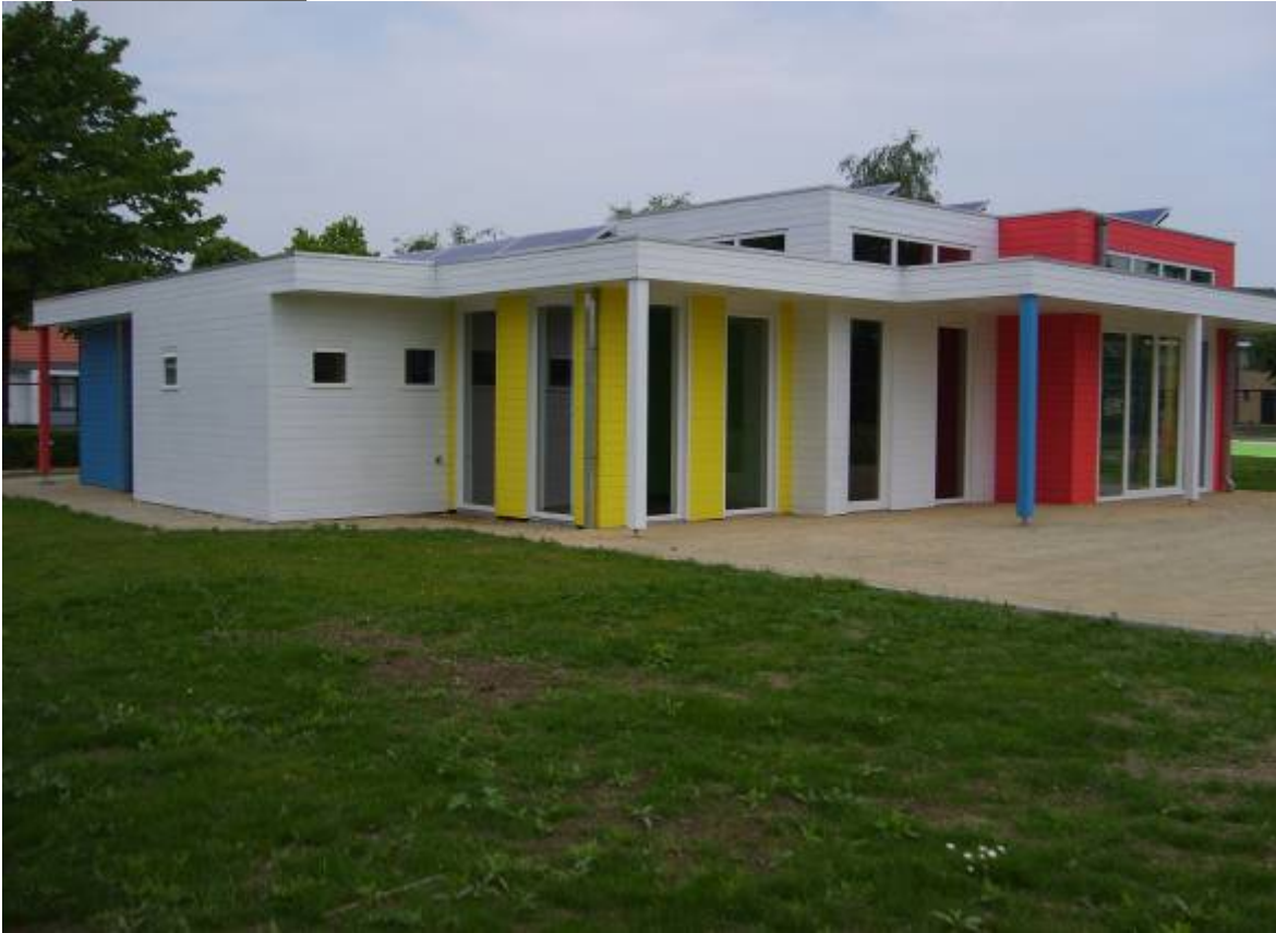
(foto: afgewerkte nieuwe paviljoen van Lokale Dienst Sint-Jozef 'Teen Machine')

Een meer dan geslaagde samenwerking tussen de technische dienst, het WOK en de andere vormen van sociale tewerkstelling!