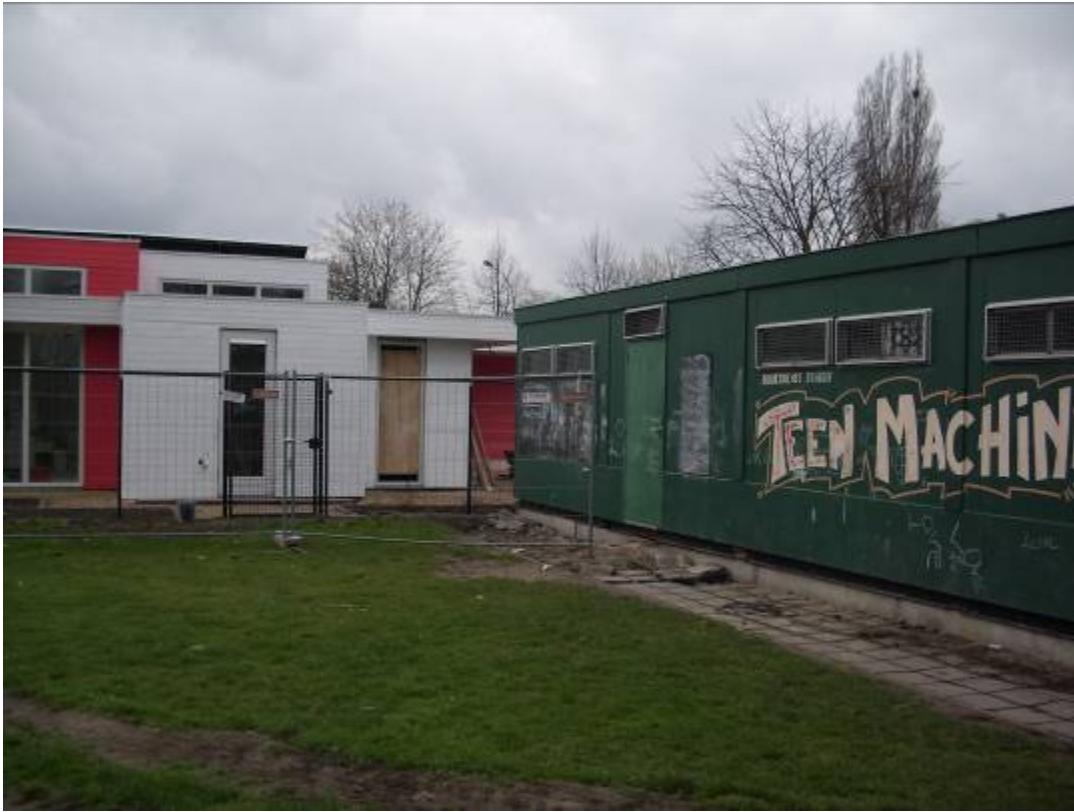
(foto: rechts het oude gebouw van Teen Machine naast het nieuwe paviljoen)

Het nieuwe paviljoen van de Teen Machine vormde een grote uitdaging voor de technische dienst van het OCMW. Het voormalige voetballokaal waarin de werking startte in 2003 was tot op de draad versleten en moest vervangen worden. De "Keet" had zijn dienst bewezen, daar was iedereen het over eens.