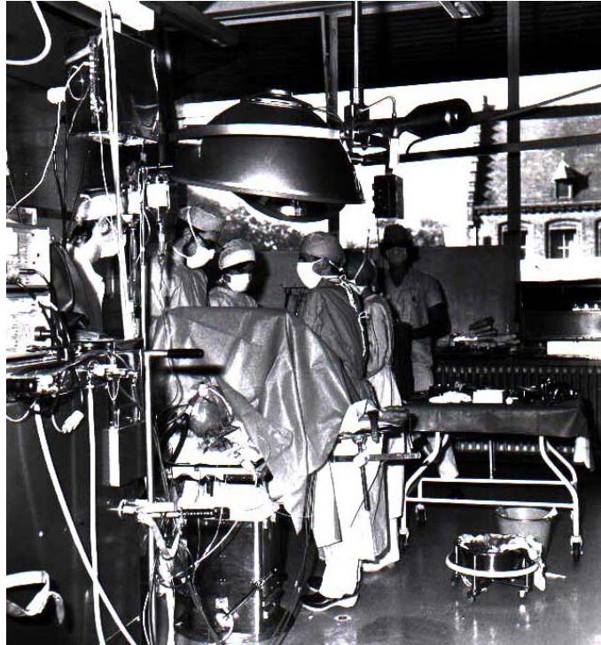
Heelkundige ingreep in het Minnewater